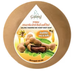
Galong Tamarind Mix Honey Body Soap การอง แทนมาริน มิทซ์ ฮันนี่ บอดี โซป

สารสกัดจากมะขามและน้ำผึ้ง อุดมไปด้วยสาร AHA มีฤทธิ์เป็นกรดอ่อนๆ สามารถขจัดสิ่งสกปรกของเซลล์ผิวที่ตายแล้ว ช่วยให้รูขุมขนกระชับ ผิวขาวกระจ่างใสอย่างเป็นธรรมชาติ