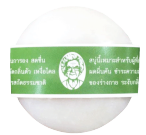
Galong Herbal Distilled & Snow Lotus Soap สบู่สมุนไพรกลั่นการอง แอนต์ บิวทิมะ

สบู่สมุนไพรกลั่นการอง กลิ่นหอม สดชื่น ฟองโฟมนุ่มละเอียด มีคุณค่าจากสารสกัดธรรมชาติ