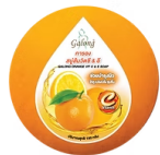
Galong Orange Vit C&E Soap การองสบู่ส้มวิตซี&อี

ส้มมีสารไฟโตนิวเทรียนต์มาก ซึ่งทำหน้าที่เป็นสารต้านอนุมูลอิสระ ปรับสภาพผิวให้กระจ่างใส กระตุ้นเซลล์ผิว จึงช่วยในการเสริมสร้างคอลลาเจนทำให้ผิวอ่อนเยาว์ เปล่งปลั่ง ทำให้ผิวกระชับ และลดริ้วรอย ฝ้า กระจ ช่วยลดปัญหาสิ่ว