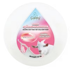
Galong Goat Milk Mix Collagen Soap การองสนุ่นนมแพะผสมคอลลาเจน

นมแพะผสมคอลลาเจน และอีลาสติน ช่วยขจัดเชื้อแบคทีเรียให้ความชุ่มชื้น ทำให้ผิวมีความยืดหยุ่น กระชับ และช่วยชะลอการเกิดริ้วรอยแห่งวัยได้เป็นอย่างดี