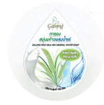
Galong Rice Milk Mix Mineral Water Soap การองสนุ่นนมข้าวผสมน้ำแร่

คุณสมบัติเฉพาะของรำข้าวและวิตามินอี มีสารต่อต้านอนุมูลอิสระ ลดเลือนริ้วรอย ชะลอริ้วรอย เพื่อให้ผิวชุ่มชื้น มี Oryza Ceramide ที่จะยกระดับและมั่นคงด้วยน้ำแร่ ทำให้ผิวขาวที่อ่อนโยนซึ่ง ให้ความชุ่มชื้นแก่ผิว