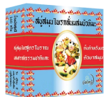
Distilled Snow Lotus Soap Bar สบู่สมุนไพรกลั่นผสมบัวทิมะ

ใช้ทำความสะอาดผิวหนังและร่างกาย ช่วยขจัดคราบโคลนบริเวณขาหนีบ ปรับสภาพผิว ที่หมักกร้านให้อ่อนนุ่มอย่างเป็นธรรมชาติ